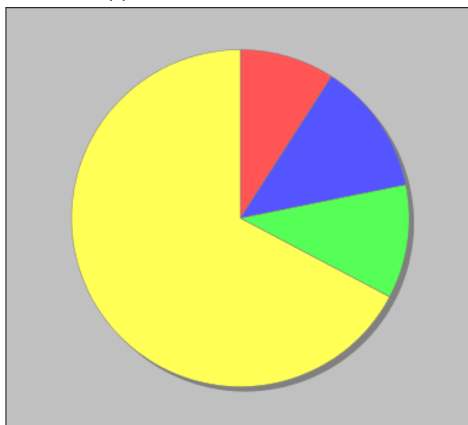
Distribuzione dei docenti a T.I. per anzianità nel ruolo di appartenenza (riferita all'ultimo ruolo)